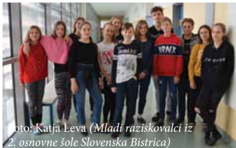
(Mladi raziskovalci iz 2. osnovne šole Slovenska Bistrica)