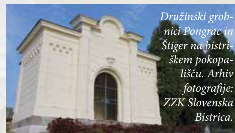
Družinski grobnici Pongrac in Štiger na bistriškem pokopališču.